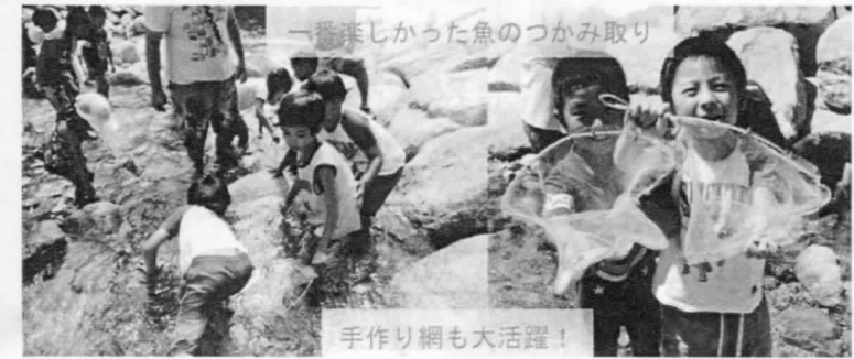
一番楽しかった魚のつかみ取り

ぐりとぐらの2つの組に分かれて、それぞれが形を考え、すてきな卵の乗り物が 出来上がりました。せみの大合唱や森の風に囲まれて普段と違う空気を味わいました。