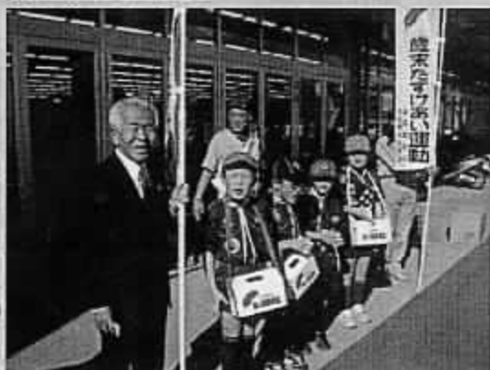
歳末助け合い募金